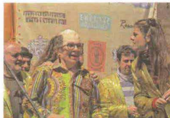
Quedada de imitadores de Chiquito de la Calzada.